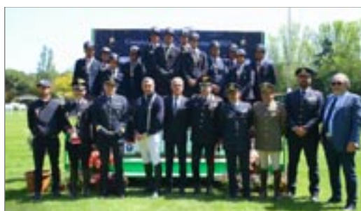
Podio Interforze a squadre - 1° Carabinieri, 2° Gruppo Sportivo Fiamme Oro, 3° Aeronautica Militare